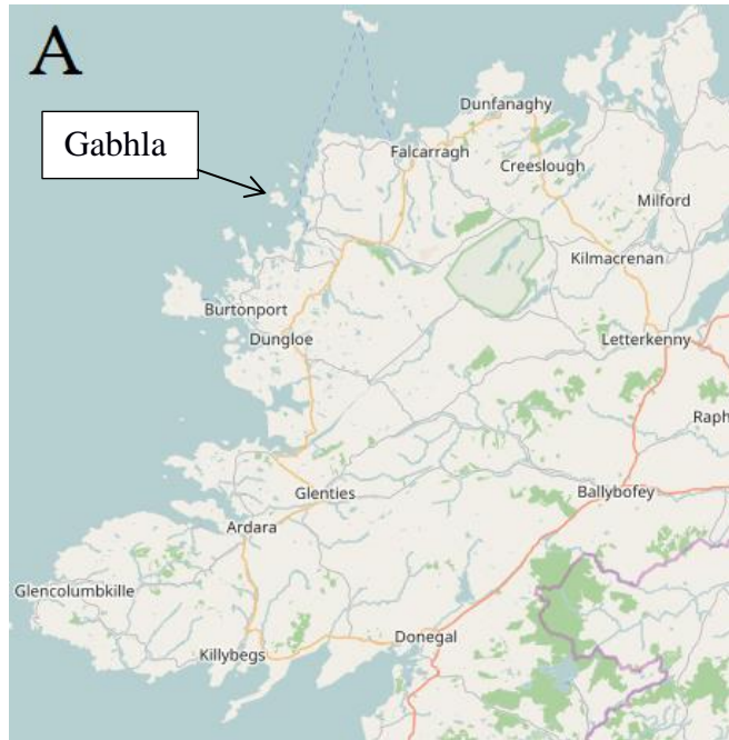
Figear 3A: Dún nan Gall: Ordnance Survey data © Crown copyright and database right 2010-12.