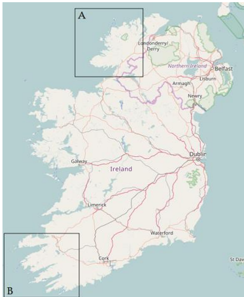
Figear 3: Èirinn; Ordinance Survey data © Crown copyright and database right 2010-12

1921. Eucoltach ri seo, anns a' Bhlascaod thàinig fàs air an àireamh-sluaigh aig toiseach an fhicheadamh linn agus b' ann an ùine na Saor-stàite a thòisich an tuiteam. Tha cunntas Sòaigh gu math àbhaisteach a thaobh eileanan na h-Alba, àireamh àrd ann an 1851 agus an sin tuiteam cunbhalach. Ann an eachdraidh Oileán na gCapall bha iad a' stri fad an eachdraidh airson fuireach. Cha robh barrachd air 20 air an eilean fad ceud bliadhna.